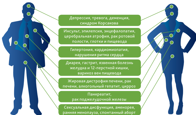
Сокращение потребления алкоголя на 50% снижает риск смерти в восемь раз